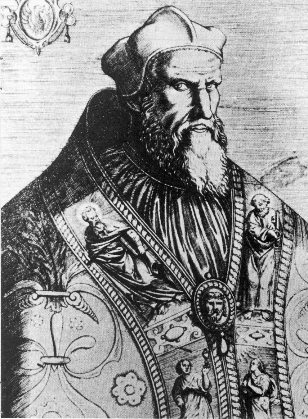
Paus Gregorius XIII (1572-1585) corrigeerde de afwijking in de Juliaanse kalender. De Gregoriaanse kalender is op dit ogenblik in gebruik.